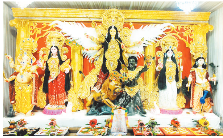
जामपारा बैकुण्ठपुर में विराजी मां दुर्गा।