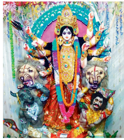
सागरपुर बैकुण्ठपुर के स्कूल ग्राउंड में विराजी मां दुर्गा।