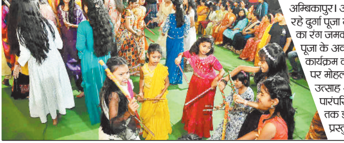
अम्बिकापुर। अनोखी सोच संस्था द्वारा मनाये जा रहे दुर्गा पूजा महोत्सव के सांस्कृतिक कार्यक्रमों का रंग जमकर चढ़ चुका है। गुरुवार को दुर्गा पूजा के अवसर संस्था द्वारा डांडिया नृत्य कार्यक्रम का आयोजन किया गया। इस मौके पर महोत्सव सहित नगर वासियों ने पूरे उत्साह और उमंग के साथ भाग लिया और पारंपरिक संगीत की धुनों पर देर रात तक डांडिया और गरबा की शानदार प्रस्तुतियां दीं। पूरे पंडाल परिसर को

रंग-बिरंगी लाइटों और आकर्षक सजावट से सजाया गया था। महिला, पुरुष और बच्चे पारंपरिक वेशभूषा में सजे-धजे पहुंचे और डांडिया की तालियों पर थिरकते नजर आए। ढोल और संगीत की धुन पर बना माहौल इतना मनमोहक था कि उपस्थित हर व्यक्ति झूम उठा। कार्यक्रम का शुभारंभ मां दुर्गा की भव्य आरती से हुआ। कार्यक्रम का सबसे आकर्षण का केंद्र रहा मगवान श्री कृष्ण और राधा जी जोड़ी, जिन्होंने अपने शानदार नृत्य कला से दर्शकों का मन मोह लिया और उपस्थित सभी लोगों को मंत्रमुग्ध कर दिया।