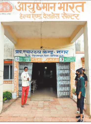
प्राथमिक स्वास्थ्य केन्द्र नगर में इलाज के लिए भर्ती मरीज।