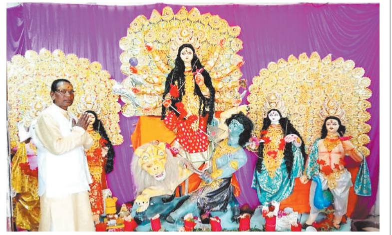
सोनहत के घुघरा में विराजी मां दुर्गा।