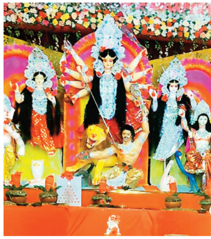
फारेस्ट कालोनी सोनहत में विराजी मां दुर्गा।