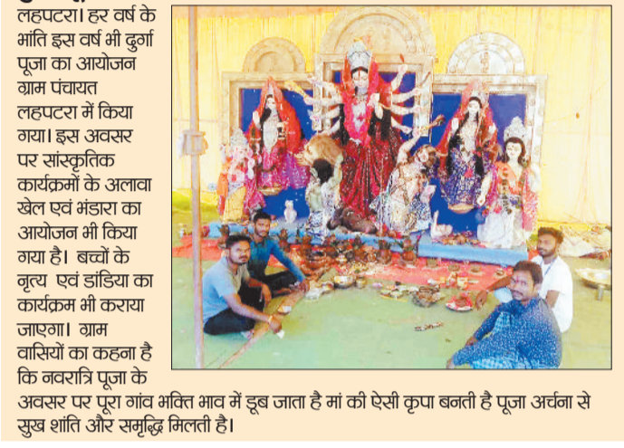
लहपट्टा। हर वर्ष के भाति इस वर्ष भी दुर्गा पूजा का आयोजन ग्राम पंचायत लहपट्टा में किया गया। इस अवसर पर सांस्कृतिक कार्यक्रमों के अलावा खेल एवं गंडारा का आयोजन भी किया गया है। बच्चों के नृत्य एवं डांडिया का कार्यक्रम भी कराया जाएगा। ग्राम वासियों का कहना है कि नवरात्रि पूजा के अवसर पर पूरा गांव भक्ति भाव में डूब जाता है मां की ऐसी कृपा बनती है पूजा अर्चना से सुख शांति और समृद्धि मिलती है।